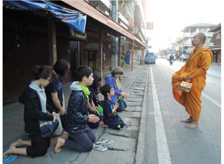
지난 2월 진행된 타이 공정여행에서 참가자들이 승려와 함께 탁발 체험을 하고 있다.