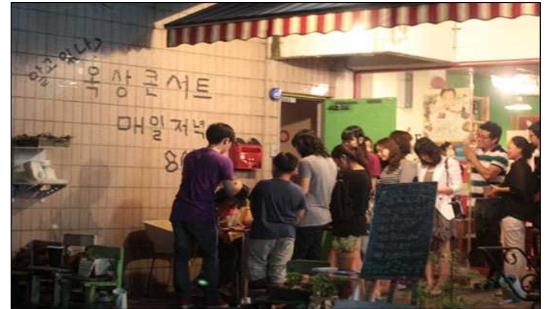
▲ 월간토마토 옥상에서 열린 옥상공연에 관객들이 입장하고 있는 모습.

환상적이다. 문제는 자금이었다. 이 과정에서 선례가 얼마나 중요한지를 여실히 깨달았다. 대흥동에 새 사무실을 구할 때도 어렵기는 마찬가지였다. 내부사정은 문 닫기 일보직전이었다. 그런 상황에서 거의 들어가지 않았던 사무실 운영비를 매월 고정적으로 지출해야 하는 새 사무실로 이전하는 것은 모험이었다. 그래도 가야한다는 생각이 강했다. 버티기보다는 공격적인 상황 돌파가 필요하다는 판단이었다. 북카페 이데 인수건도 비슷한 틀에서 해석했다.