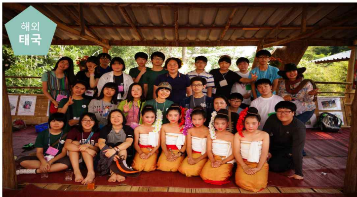
나파우끼우 청소년 여행학교, 공생의 마을살이