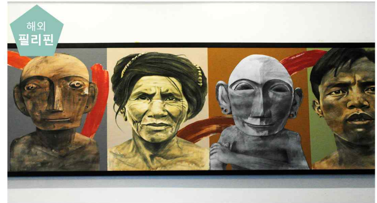
예술, 이고룻과 탐아완에서 만나다