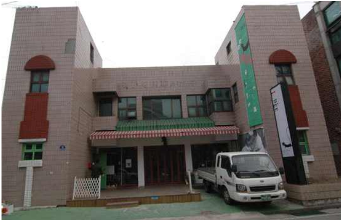
▲ 월간 토마토 대흥동 사무실 전경.