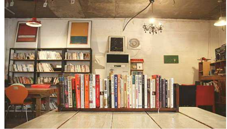
▲ 북카페 이데 내부 모습.

대흥동은 월간 토마토에게 중요한 의미다. 월간 토마토가 새롭게 출발한 대흥동은 '반석'이란 다. 아는 사람 만 아는 이야기다. 대흥동이 거대한 돌, 반석 위에 올라앉아 어지간히 기가 센 사람이 아니면 버티기 어렵 지만, 기가 맞으면 일이 술술 풀린다는 이야기다. 그래서일까? 하루하루 버티기가 너무 어려웠던 월간 토 마토에 살아갈 방법이 나타났다.