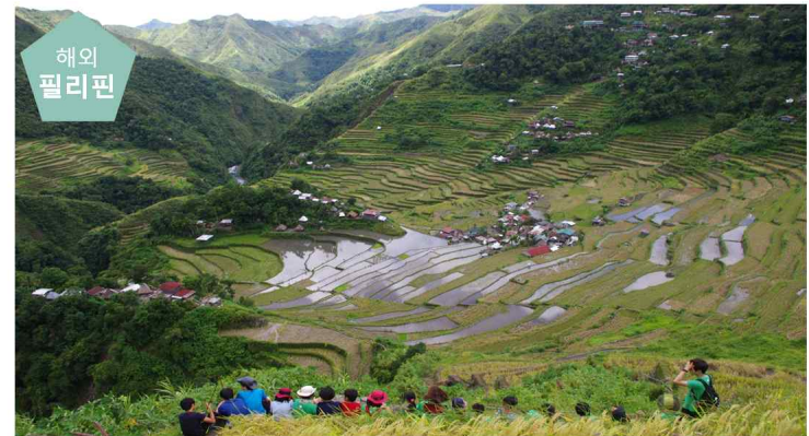
천상의 녹색계단, 바타드 가는길