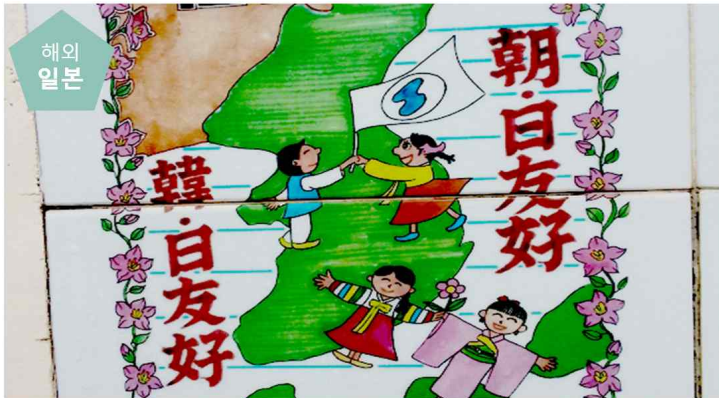
선입견을 넘어 공존으로, 규슈 역사·평화 여행학교