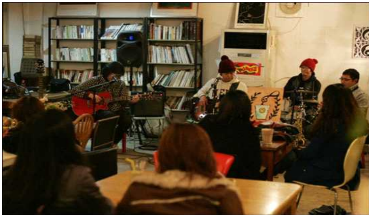
▲ 북카페 이데 공연 모습.

전문 기획사가 아닌 잡지사에서 만들어내는 디자인 작업물이 주는 '파격'이 신선했던 모양이다. 경험은 미천했고 해야 하는 당위는 분명하니 독특한 결과물을 만들어낸 것이다. 코드가 맞는 사람과 단체에서 하나둘 찾아왔다. 그중 많은 이들은 월간 토마토가 쓰러지지 않고 잘 살아남기를 바라는 지지자였다. 죽기 십상인 나무에 열심히 물을 주려는 사람들이었다. 이 감동은 단순한 재정적 지원을 넘어 강력한 에너지였다.