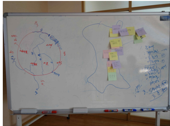
<대덕구 자원 알아보기>