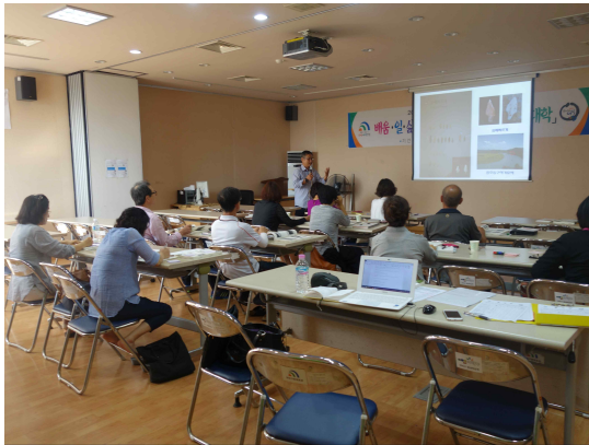
<3차시 수업 모습>