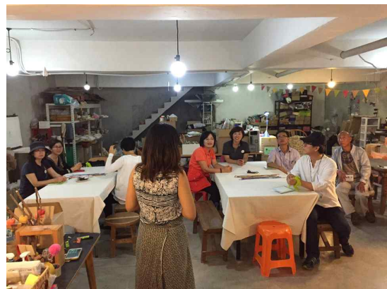
<대흥동 공정여행 - 아트팩>