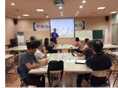
<2차시 수업 모습>