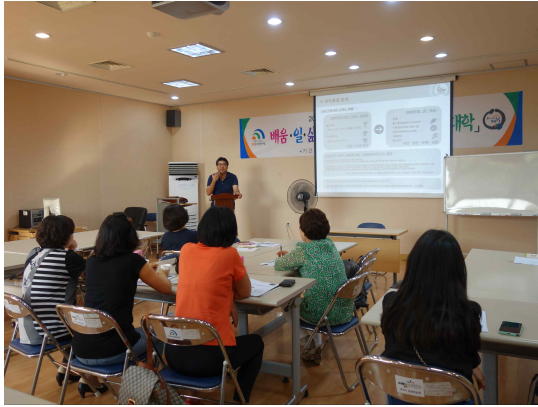
<1차시 수업 모습>

○ 학생들에게 생소한 공정여행 개념을 알리는데 탁월한 수업이었다고 생각됨. 이는 설문지 결과에서도 알 수 있음