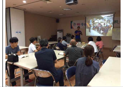
<2차시 수업 모습>