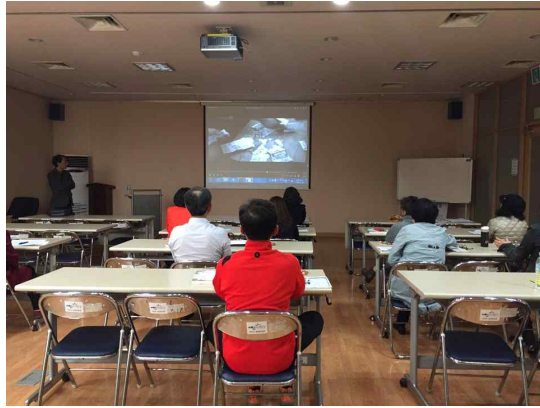
<9차시 강의 모습>