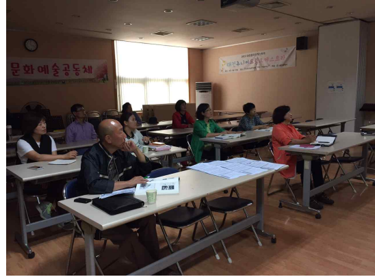
<진지하게 수업을 듣는 수강생들>