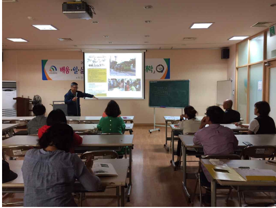
<5차시 수업 모습>