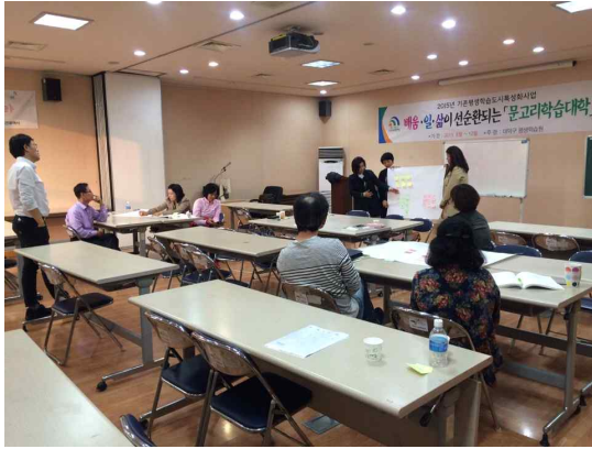
<조별 발표 모습>