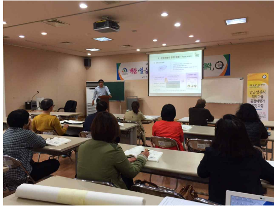
<8차시 강의 모습>