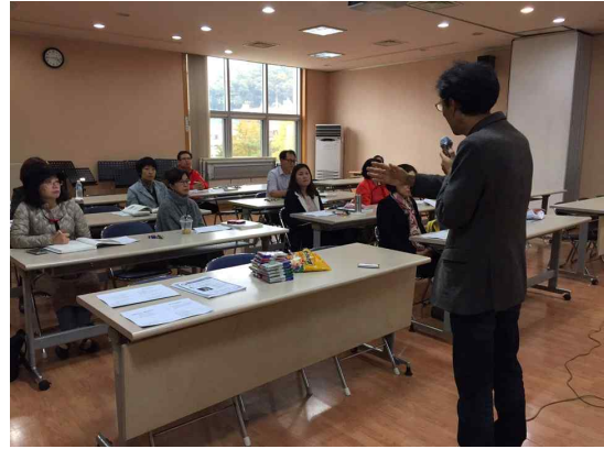
<9차시 강의 모습>