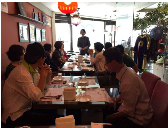
<대흥동 공정여행 - 아임아시아>